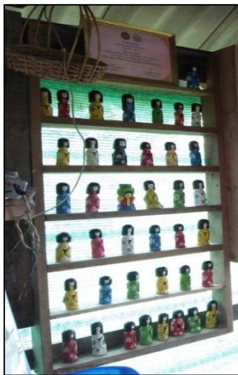
ตุ๊กตาไม้