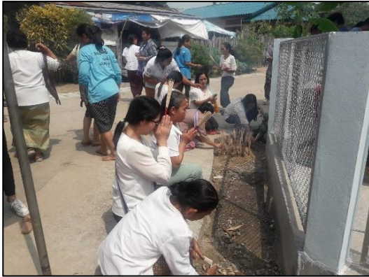
ชาวบ้านร่วมทำบุญเสาสหลักเมือง

- ภาพผลงานต่าง ๆ ด้านหัตถกรรมพื้นบ้าน การถักแห