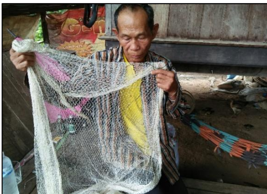
ถักแหจับปลาตาเล็ก