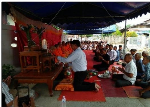
จัดเตรียมรูป เทียน ดอกไม้ สำหรับพิธีทำบุญเสาหลักเมือง