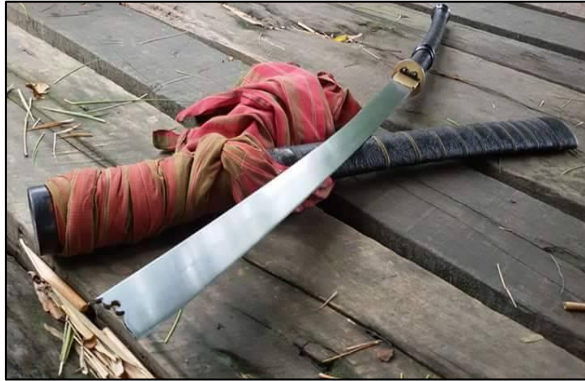
ดาบปลายตัด