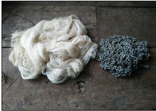
แหที่ถักเสร็จแต่ยังไม่ใส่เหล็กห่วงโซ่