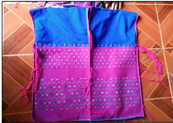
เซโมชู เสื้อปกากะญอผู้หญิงที่แต่งงานแล้ว

- ภาพผลงานต่าง ๆ ด้านศิลปหัตถกรรมพื้นบ้าน การทอผ้า