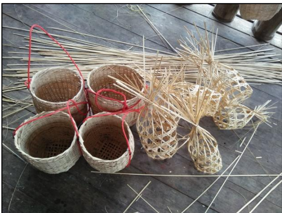
ตะกร้าและชะลอมเล็ก