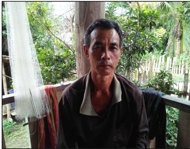
ภาพผลงานต่าง ๆ ด้านศิลปหัตถกรรมพื้นบ้าน การถักแห