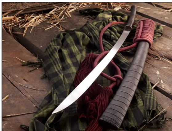
ดาบใบข้าว