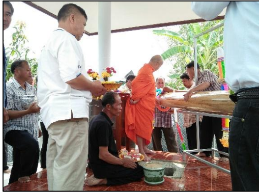
อาจารย์ทันตดูแลพิธีทำบุญเสาสหลักเมือง

- ภาพผลงานต่างๆ ด้านประเพณีพิธีกรรมพื้นบ้าน พิธีทำบุญเสาสหลักเมือง