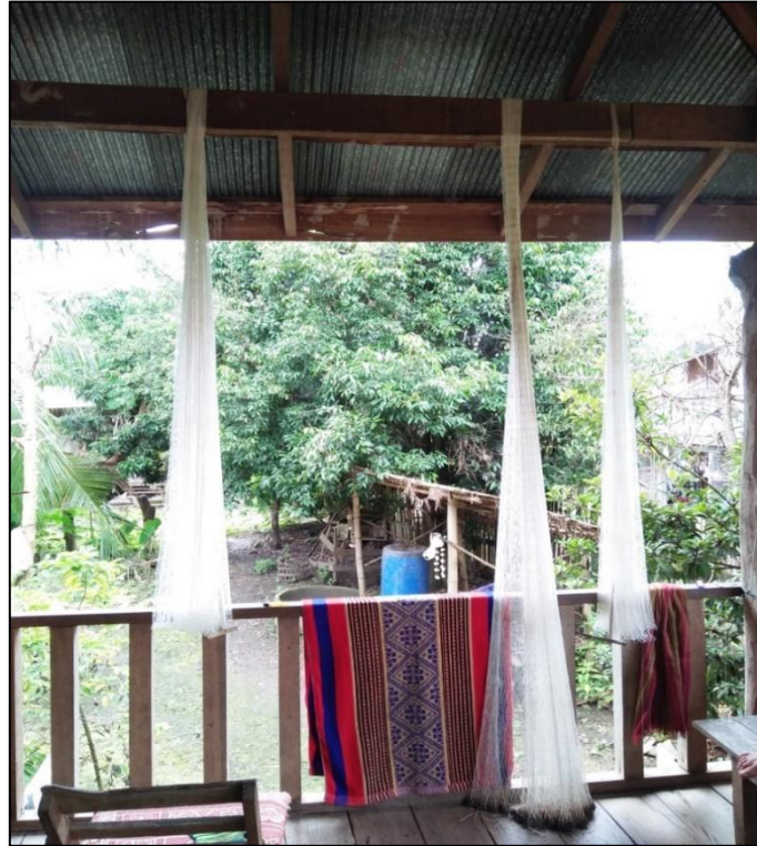
- ภาพที่อยู่