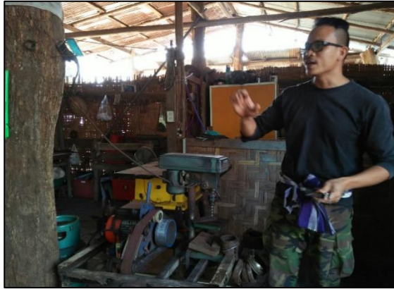
เครื่องเจาะเหล็กไฟฟ้า