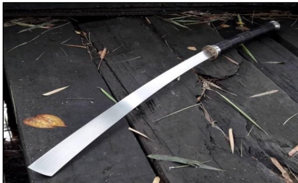
ดาบปลายตัด