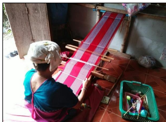
การทอผ้าห่มของปกากะญอ