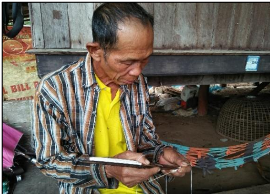
การเริ่มถักแหจับปลา

- ภาพผลงานต่าง ๆ ด้านหัตถกรรมพื้นบ้าน การถักแห