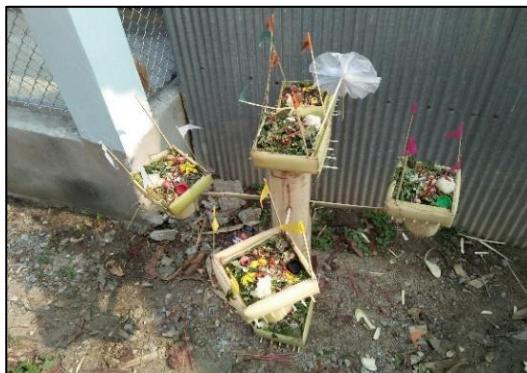
กระถางถวายพิธีทำบุญเสาหลักเมือง