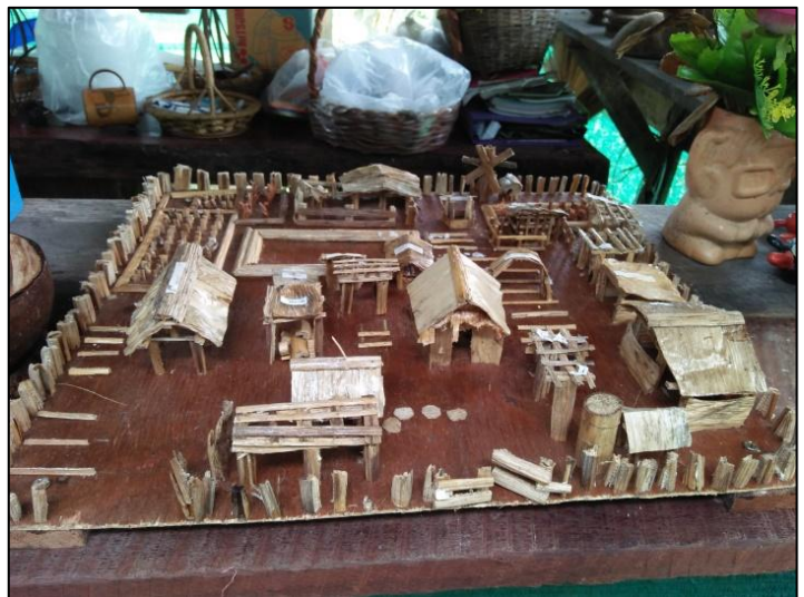
งานแบบแปลน