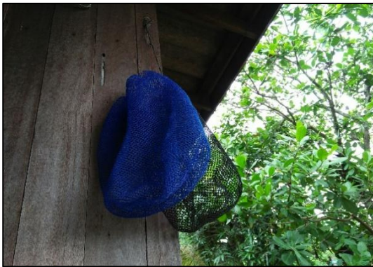
สวิงใส่ปลา