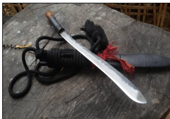
ดาบปลายบัว