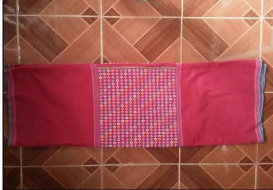
หนี่ ผ้าถุงผู้หญิงของชาวปกากะญอ