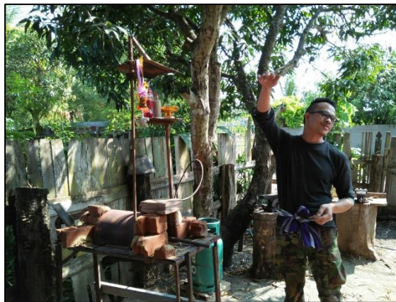
เครื่องเผาเหล็กขณะตีมีด ตีดาบ