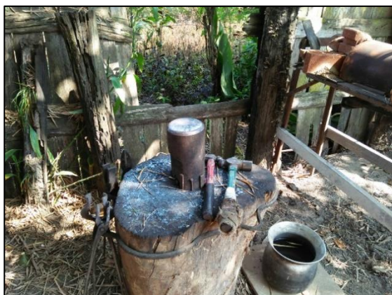
เครื่องรองการตีเหล็ก