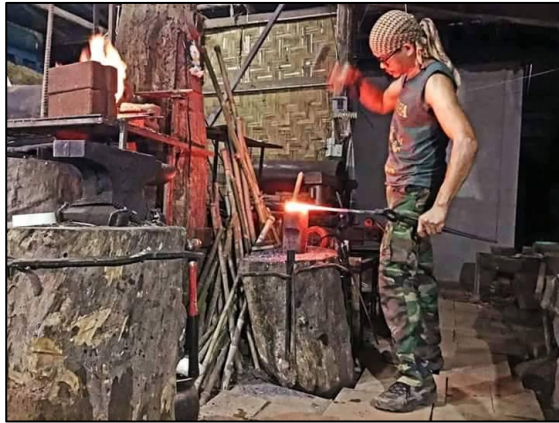
นำเหล็กเผาจนแดงมาตีดาบ