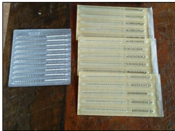
เข็มที่ใช้เป็นการรักษาแบบแพทย์แผนจีน

หนังสือรวมองค์ความรู้สมุนไพรชาวเขาชาติพันธุ์ม้งบ้านทรัพย์เจริญ