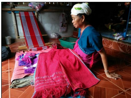
ยะ ผ้าห่มชาวปกากะญอ