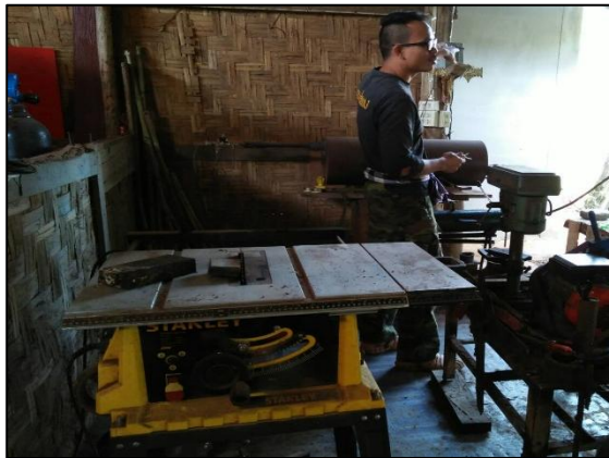
เครื่องตัดเหล็กไฟฟ้า