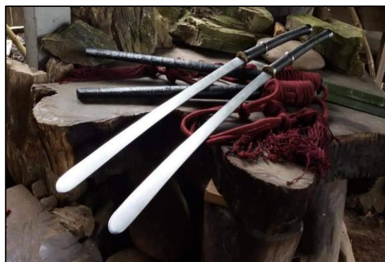
ดาบกลีบบอกบัว