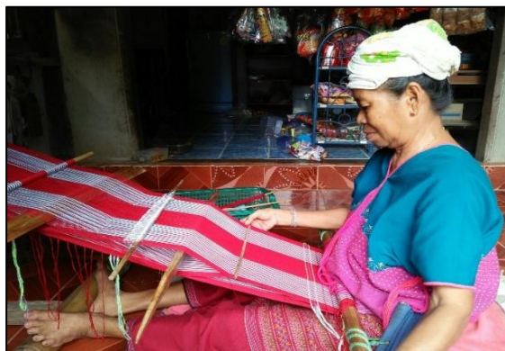
ขั้นตอนในการทอผ้า